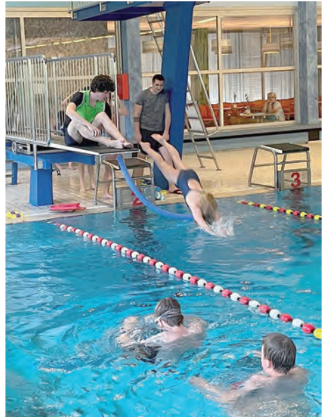
Die Leistungsgruppe beim Training

Montags und donnerstags ab 18 Uhr können Kinder, die das Seepferdchenabzeichen erworben