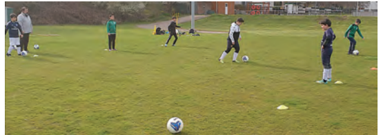
„Training auf dem B-Platz“