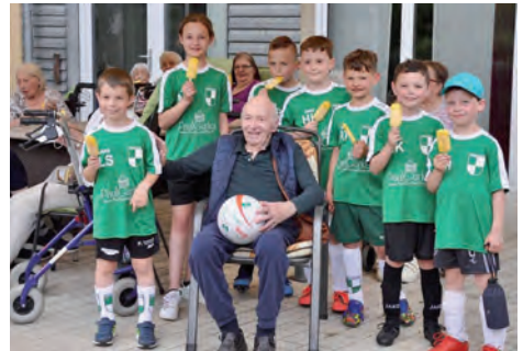
Stippvisite im Teresienhof: Fußball-Sachverständiger trifft Fußball-Sachverständiger

In oder kurz nach der Corona-Pause haben wir auch vier Neuzugänge erhalten, die sich schon gut in die Mannschaft integriert und eingefügt haben. Um den Zusammenhalt der Mannschaft zu stärken, planen wir auch immer mal eine Akti-