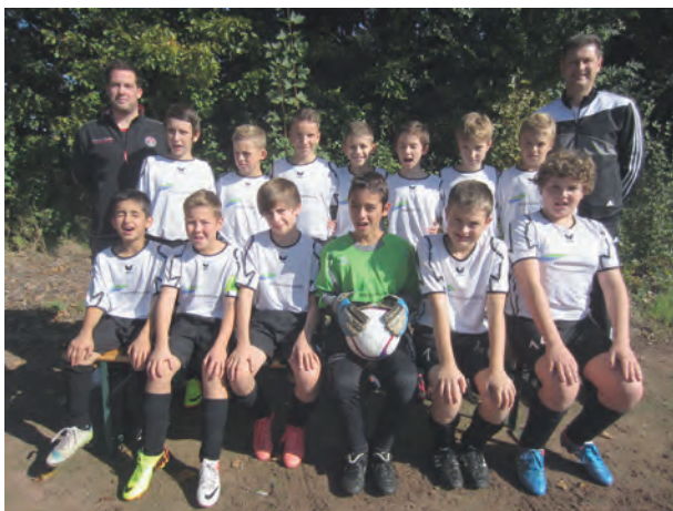
... in 2013 ist der Auftritt schon viel professioneller

Wie alle konnten auch wir leider jeweils nur eine Hinrunde spielen. Die letzte Spielzeit beendeten wir auf dem 2. Tabellenplatz und mussten uns in der Hinrunde nur einer Mannschaft knapp geschlagen geben. Um den Jungs einen vernünftigen