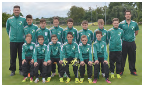
... Der 2002er Jahrgang entwickelt sich zu gestandenen Jungs im Jahr 2014 ...