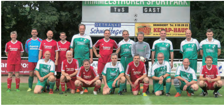
Mannschaftsfoto vom Abschiedsspiel Altsenioren gegen Altsenioren