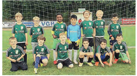
Gruppe „Weiß“: Trainingsspiel gegen die U7

Wie bei allen anderen Mannschaften auch, war die Freude sehr groß, dass nach der langen Corona-Pause wieder zusammen trainiert werden durfte. Die Trainingsbeteiligung war großartig. In den ersten Wochen sollten die Kinder einfach „nur“ Fußball spielen um wieder in den Rhythmus zu kommen. Die U7 hat aktuell 28 Spieler im Kader, daher wurden die Kinder erstmals in 2 Gruppen aufgeteilt. An unserem Trainingstag