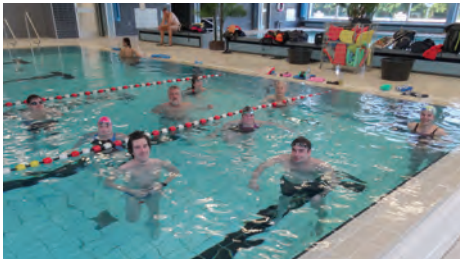
Die Basisgruppe beim Training

Am Montag, den 07.06.2021 war es endlich soweit. Die Himmelsthürer Schwimmhalle wurde nach dem Lockdown wieder geöffnet und unsere Schwimmsparte konnte den Trainingsbetrieb wieder aufnehmen. Die Vorgaben für das Hygienekonzept von Eintracht war wie im letzten Jahr unverändert, sodass alle Schwimmer sich nicht umstellen mussten. Nach 7 Monaten Stillstand waren alle glücklich, endlich wieder ins Wasser zu gehen und die rückgebildete Muskulatur wieder in alte Formen zu bringen. Das Angebot für alle schwimmbegeisterten Menschen kann unsere Schwimmsparte voll erfüllen.