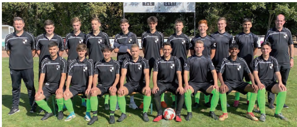
Die 2002er im letzten Jahr im Jugendbereich als U19