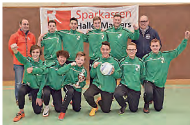
... Die 2002er werden im Jahr 2018 Hallenkreismeister ...