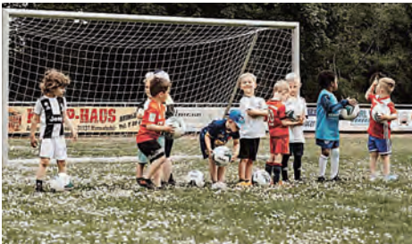
Sieht idyllisch aus, ist aber hartes Training von Standardsituationen