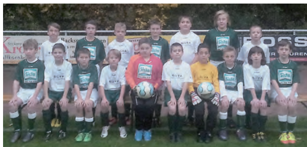
Die Zeitreise des Jahrgang 2002 beginnt 2012, damals als U10 ...