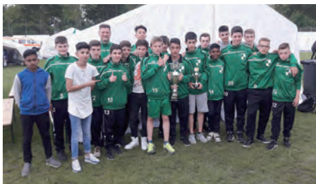
... und nimmt gerne das ein oder andere Zeltlager mit (2017)