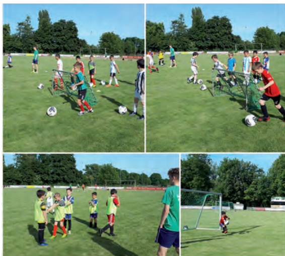
Trainingseindrücke der U10/11-Team 2011