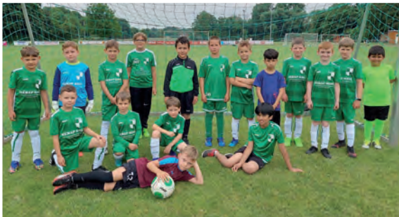
Die U8 im Großaufgebot