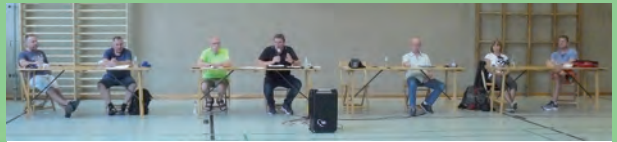
Vorstand mit Abstand

Redaktionsschluss für die nächste Ausgabe 24. November 2021!