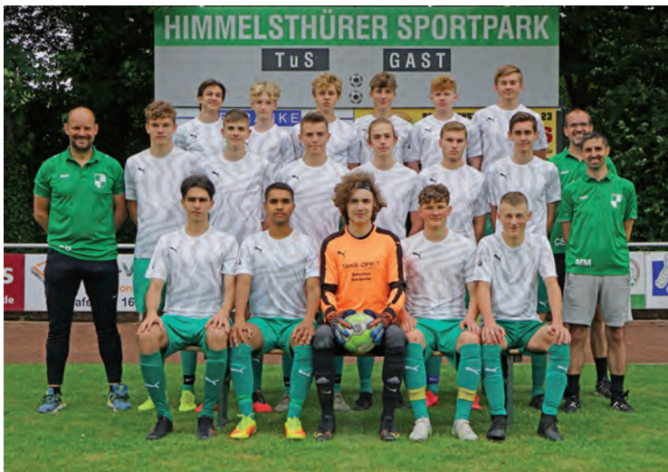
Die U17I in der Saison 2020/21

Dieser Plan ging voll auf. Denn in allen Partien wurden die Grün-Weißen richtig gefordert. Sie steigerten sich von Spiel zu Spiel und konnten abgesehen von einem 2:2 gegen den Landesligisten BVG Wolfenbüttel alle Gegner bezwingen,