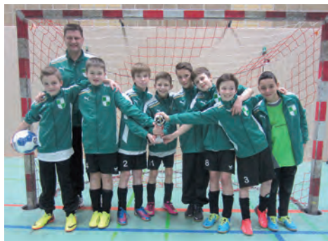
Weiter geht es mit einem 4. Platz beim SC Harsum im Jahr 2014 ...