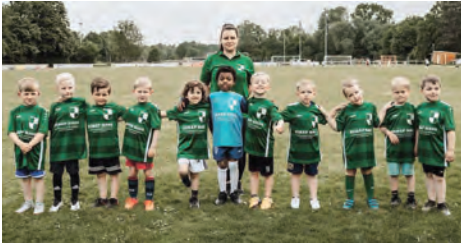
Hallo! Wir sind die U5