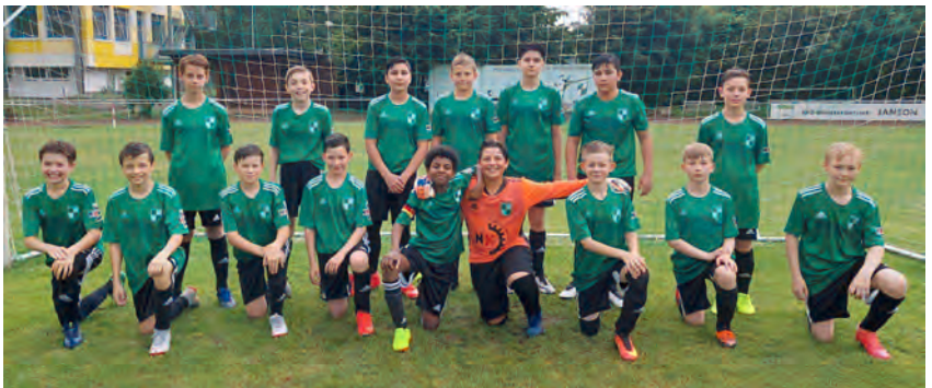
U13: Endlich geht es wieder los

platz stehen zu dürfen. Für uns wird es eine besondere Saison, denn die Mannschaft spielt nun auf dem ganzen Feld. Es ist schön zu sehen, mit welcher Begeisterung die Mannschaft Fußball spielt und sich weiter entwickelt. Da momentan kein Punktspielbetrieb stattfindet, nutzten wir die