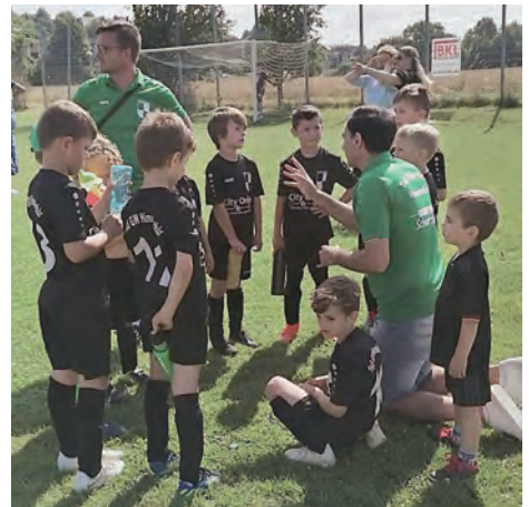
Gruppe „Grün“: Ansprache vor dem Spiel gegen TSV Krähenwinkel/Kaltenweide

Am Sonntag, den 18.07.2021 haben wir am Dost-Kids-Cup in Itzum teilgenommen. In unserer Gruppe waren der SV Blau-Weiß Neuhoof, der 1.FC Sarstedt, der TSV Krähenwinkel/Kaltenweide und der MTV Rethmar. Unsere Mannschaft war sehr motiviert, um nach den Gruppenspielen