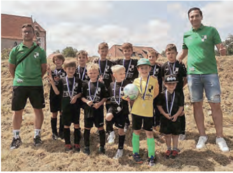
Gruppe „Grün“: Dost-Kids-Cup in Itzum

in das Halbfinale einzuziehen. Mit 14:3 Toren und 7 Punkten wurde dieses Vorhaben leider haarscharf verpasst. Im Spiel um Platz 5 ging es gegen den VFL Nordstemmen, welches mit 7:0 gewonnen werden konnte. Auch wenn die Platzierung es nicht widerspiegelt, hat sich die Mann-