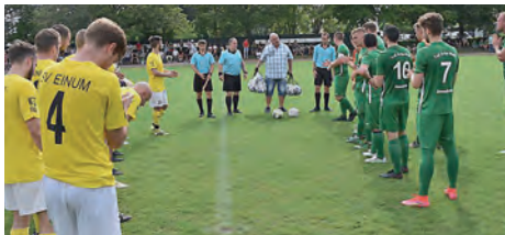
Siegerehrung nach dem 2:0 Erfolg im Finale des NFV-Sommer-Cups

Mitte gebracht wurde. Dort unterlief einem SV-Verteidiger ein unglückliches Eigentor, dass die Entscheidung in dem Finale herbeiführte. Im Großen und Ganzen geht der Finalsieg für unser Team in Ordnung, da man trotz einiger ausgelassener Chancen das Spiel weitestgehend im Griff hatte. Nichtsdestotrotz muss man den Gästen ein Kompliment für einen guten Auftritt aussprechen. Als Siegesprämie gab es derweil ein Ballnetz mit fünf neuen Trainingsbällen für die Genc-Elf. Wir sagen an dieser Stelle noch einmal vielen Dank.