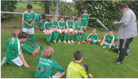
„Halbzeitansprache beim Testspiel“

die Mannschaft verlassen. Leider fehlt uns der Spielbetrieb als älter Jahrgang der E-Jugend doch immens, denn wir starten nach den Sommerferien in der D-Jugend. Für uns bedeutet das Abschied vom Kleinfeld der jüngeren Jahrgänge. Als U12 spielen wir künftig von 16er zu 16er in einer 9er Mannschaft. Hier stürmen viele Aspekte auf die Spieler ein. Dinge, die in jüngeren Jahrgängen noch möglich waren, macht die Größe des neuen Spielfeldes zu einem schwierigen Unterfangen. Inzwischen haben wir einige Testspiele hinter uns und die Spieler konnten ihre Erfahrungen auf dem größeren Feld machen. Nun gilt es, aus diesen Erfahrungen seine Schlüsse zu ziehen, und die Vorbereitung für die neue Saison