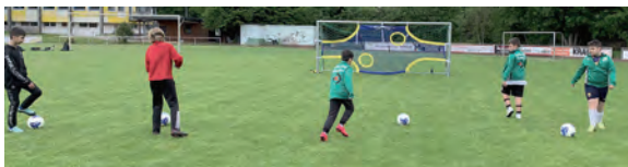
„Neues Trainingsgerät in der Erprobung!“

gangen. Ein Mitspieler hat sich in dieser Zeit auch gegen einen Neustart im Fußball entschieden und